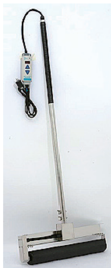
組み立て 完成写真